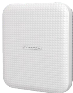
ローカル 5G 対応基地局（スモールセル）準同期対応 オールインワン「Cedar」

ウビコムは、Compal 社製のローカル 5G 対応基地局（スモールセル）「Cedar」とオープンソースの 5G コアネットワークを組み合わせ、最小構成 250 万円から提供します。